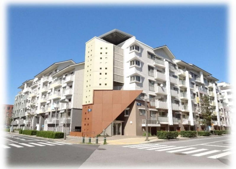
幕張ベイタウン内パティオス（賃貸住宅）