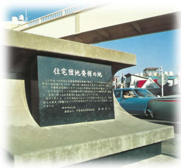
全国初の住宅団地記念碑（京成八千代台駅前）