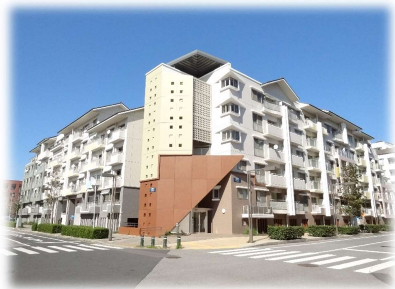
幕張ベイトウン内パティオス(賃貸住宅)